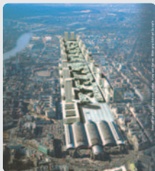
links oben und unten Wenn Bahnhöfe unter die Erde verlegt werden könnten, wie hier in der Computersimulation für Frankfurt, attraktive Erholungsflächen entstehen.

rechts Mit künstlichen Erdbenenwellen können moderne Vorerkundungssysteme den Baugrund abtasten und Hindernisse im Voraus erkennen.