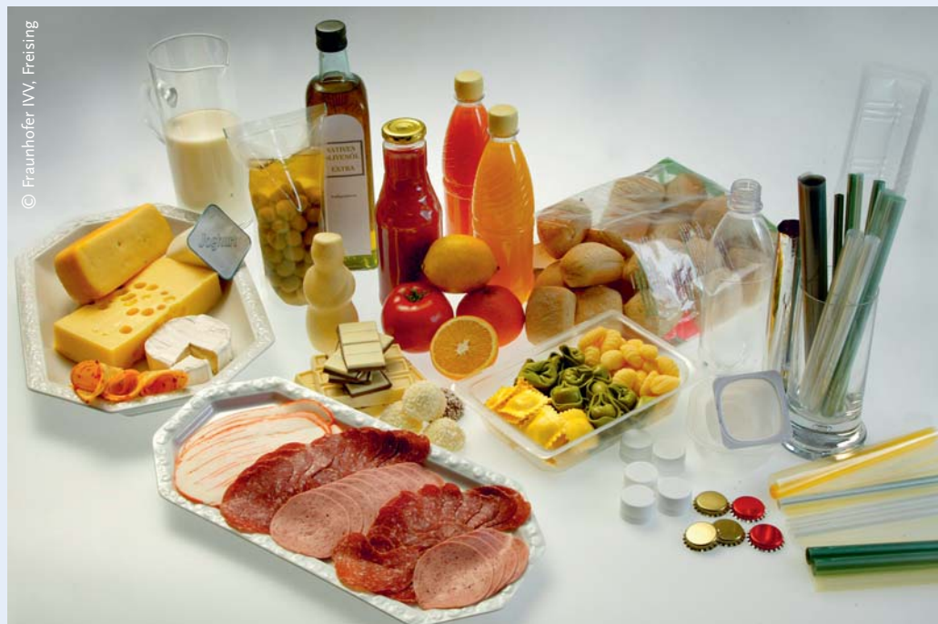
ABBILDUNG 1: Ein transdisziplinäres Projektteam untersucht im Rahmen der Sozial-ökologischen Forschung, wie Verbraucher(innen) Plastikmüll reduzieren können. Außerdem entwickelt es Strategien, wie überflüssige Verpackungen im Herstellungsprozess von Lebensmitteln und Textilien vermieden werden können.

Betker, F. 2015. Risiken durch Mikroplastik und die Ambivalenz von Plastikkreisläufen. GAIA 24/2: 130–131.