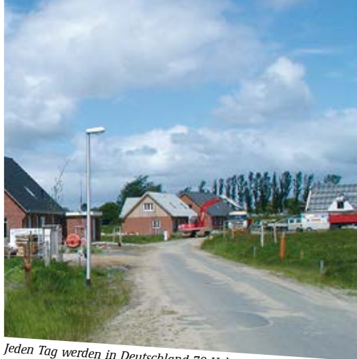
Jeden Tag werden in Deutschland 70 Hektar neu bebaut

Mit dem Rahmenprogramm FONA – Forschung für Nachhaltige Entwicklung – setzt das Bundesministerium für Bildung und Forschung (BMBF) seit mehreren Jahren wichtige Akzente, um dazu beizutragen, Städte, Kommunen, Unternehmen und die Zivilgesellschaft zukunftsfähig zu machen. In den FONA-Leitinitiativen Green Economy, Zukunftstadt und Energiewende werden Strategien, Modelle und Produkte erforscht, entwickelt und in der Praxis erprobt. Die transdisziplinäre Zusammenarbeit von Wissenschaftlern, Kommunen, Unternehmen und gesellschaftlichen Akteuren ist dabei wegweisend – und ein wesentlicher Faktor für die erfolgreiche Umsetzung von nachhaltigen Lösungen. Es braucht allerdings Zeit, bis die Forschungsergebnisse in der Praxis Früchte tragen; einen Teil hiervon stellen wir in diesem Heft vor.