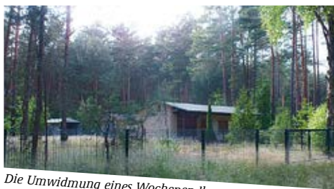
Die Umwidmung eines Wochenendhaus-Gebiets kann teuer werden