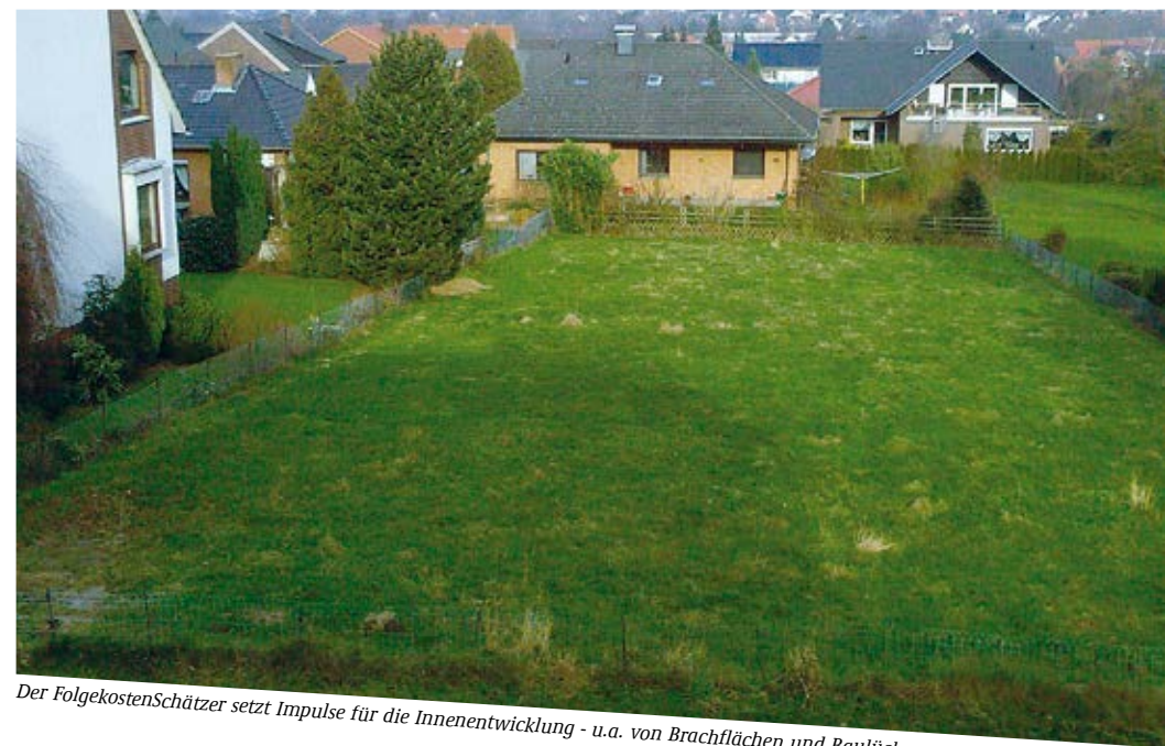
Der FolgekostenSchätzer setzt Impulse für die Innenentwicklung - u.a. von Brachflächen und Baulücken

Jörg Finkeldei, Ministerium für Infrastruktur und Landesplanung des Landes Brandenburg