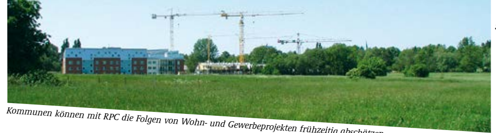
Kommunen können mit RPC die Folgen von Wohn- und Gewerbeprojekten frühzeitig abschätzen