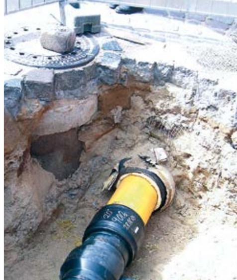
Folgekosten für die Infrastruktur von Baugebieten werden häufig unterschätzt

Im Jahr 2011 startete die Oberste Baubehörde im Bayerischen Staatsministerium des Innern, für Bau und Verkehr gemeinsam mit dem Bayerischen Landesamt für Umwelt das Modellprojekt „Infrastruktur-Folgekosten von geplanten Wohnbaugebieten“, um den FolgekostenSchätzer in der kommunalen Praxis zu testen und an die Bedarfe der bayerischen Kommunen anzupassen. „Der Flächenverbrauch durch Siedlung und Verkehr ist in Bayern mit 18 Hektar pro Tag (Stand 2013) immer noch hoch, obwohl die Bevölkerungszahlen bereits vielerorts stagnieren oder abnehmen“, erläutert Claus Hensold vom Bayerischen Landesamt für Umwelt. „Unser Anliegen ist, die Kommunen zu einer kompakten, flächensparenden Siedlungspolitik zu motivieren, also beispielsweise Brachflächen und Baulücken im Innenbereich zu nutzen.“