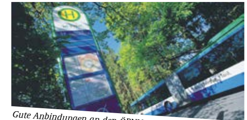
Gute Anbindungen an den ÖPNV ersparen das Zweitauto