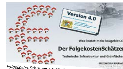
FolgekostenSchätzer 4.0 für bayerische Kommunen