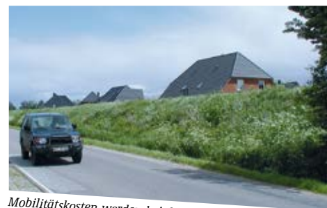
Mobilitätskosten werden bei der Wahl des Wohnstandorts kaum berücksichtigt

„Als ein Ergebnis der Fördermaßnahmen „REFINA“ und „Nachhaltiges Landmanagement“ wurden Entscheidungsträgern in Kommunen, Planungsbüros sowie Bürgern anwendbare Produkte zur Verfügung gestellt. Die Forschungsergebnisse werden – direkt oder nach einer entsprechenden Weiterentwicklung durch Kommunen bzw. Bundesländer – genutzt. Das zeigt beispielsweise die Verbreitung verschiedener Kostenrechner. Mit dem BMBF-Rahmenprogramm „Forschung für Nachhaltige Entwicklung“ setzen wir so Impulse für tragfähige regionale Lösungen und die Zukunft von Kommunen.“