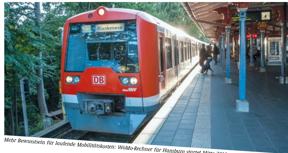
Mehr Bewusstsein für laufende Mobilitätskosten: WoMo-Rechner für Hamburg startet Mitte 2016

Die Folgen hoher Wohn- und Mobilitätskosten sind auch in der Metropolregion Hamburg zu spüren. Wohnen im Hamburger Kern wird immer teurer. Das führt zu einer Abwanderung ins Umland und forciert eine dezentrale Bevölkerungsentwicklung. „Wir wollen unseren Kunden ein kostenfreies Werkzeug anbieten, das sie bei der