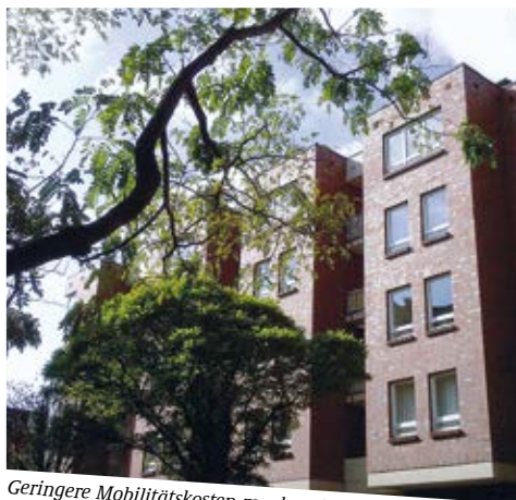
Geringere Mobilitätskosten machen Städte attraktiv