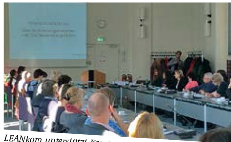
LEANkom unterstützt Kommunen bei strategischen Entscheidungen der Stadtentwicklung