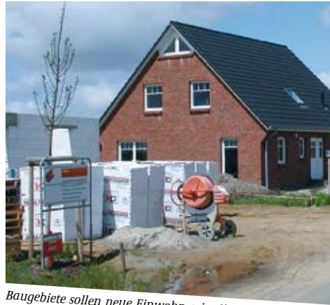
Baugebiete sollen neue Einwohner in die Kommunen „locken“

Das Projekt war Teil der Fördermaßnahme REFINA (Forschung für die Reduzierung der Flächeninanspruchnahme), die vom Bundesministerium für Bildung