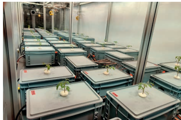
Die hydroponische Pflanzenproduktion mit salzhaltigen Wässern wird im Phytotechnikum der Universität Hohenheim erprobt

Herzstück des in EXALT entwickelten gekoppelten Verfahrens ist ein geschlossener Kühlkreislauf, der die Feuchtigkeit und Temperatur im Gewächshaus aufeinander abstimmt und so optimale Bedingungen für das Wachstum der Pflanzen schafft. Anstatt diese Parameter wie üblich über einen Luftaustausch mit der Außenumgebung zu steuern, entzieht eine Wärmepumpe aktiv Wärme aus dem Gewächshaus. Das über die Blätter der Pflanzen verdunstete Wasser kann durch die niedrigeren Temperaturen kondensieren, zurückgewonnen und wieder zur Bewässerung genutzt werden.