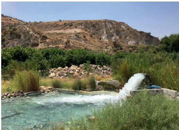
Artesischer Brunnen im Mukheibeh Weil Field (Jordanien). Bei einem artesischen Brunnen tritt Wasser unterhalb des Grundwasserspiegels von selbst aus.

Der Yarmouk ist der Hauptzustrom in den Jordan und zugleich eine wichtige strategische Trinkwasserressource für Syrien, Jordanien und Israel. Das vergleichsweise niederschlagsreiche Einzugsgebiet des Flusses erfüllt wichtige Funktionen für die Ökologie im Unteren Jordantal und damit auch für das Tote Meer. Es stellt die Bewässerung in der Region sicher und versorgt unter anderem seit 2020 über die Al Arab II Wasserversorgungsanlage circa zehn Prozent der jordanischen Bevölkerung mit Wasser. Der Gewässerabfluss ist jedoch durch oberstromige Sperrbauwerke stark reguliert. Nur frei ausströmendes Grundwasser aus dem jordanischen Ajloun-Gebiet erhält den Fluss am Leben.