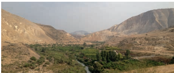
Blick in die untere Yarmouk-Schlucht

TransFresh soll einen wichtigen Beitrag leisten, um die Wasserversorgung aus dem Yarmouk-Becken langfristig zu stabilisieren und damit die Beziehungen zwischen den Anrainern zu verbessern. Stakeholder und Entscheidungsträger werden von Beginn an in den Entwicklungsprozess des Projektes einbezogen; das sorgt für praxistaugliche Ergebnisse, die auch tatsächlich umgesetzt werden. Das Projekt ist darüber hinaus so konzipiert, dass die Methoden auch auf andere Regionen mit grenzüberschreitenden Wasserressourcen übertragen werden können.