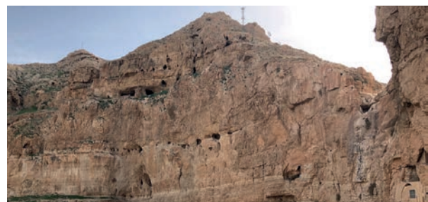
Geklüftete Gesteinsformationen können als wasserwirtschaftliche Speicher dienen

in diesen Gesteinsformationen liegen häufig in großer Tiefe. Eine Erneuerung des Grundwassers durch hereinströmendes Niederschlagswasser von der Oberfläche kann dadurch mehrere Jahre dauern. Durch Klüfte und Störungen können Teile des Wassers jedoch erheblich schneller, teils innerhalb von wenigen Stunden, durch die Gesteinsschichten fließen. Das erschwert eine Vorhersage der zeitabhängigen Grundwasserneubildung häufig extrem. Frühere Untersuchungen zeigen auch, dass die in der Region vorherrschenden Gesteinsformationen zwischen Grundwasserspiegel und Erdoberfläche wasserwirtschaftlich als Langzeitspeicher dienen und entsprechend in Dürreperioden berücksichtigt werden können.