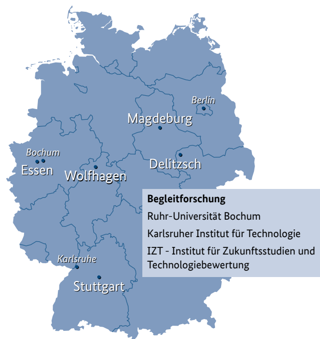
Übersichtsschema der Gewinnerstädte und Begleitforschung des BMBF-Wettbewerbs „Energieeffiziente Stadt“

Wie komplexe Planungsprozesse optimiert werden können, wollen die Wissenschaftlerinnen und Wissenschaftler mit Untersuchungen zur integralen Planungsmethodik herausfinden. Mit dieser Herangehensweise, die in der Regel zur Lösung einer komplexen Aufgabe genutzt wird, soll die energieeffiziente kommunale Entwicklung erleichtert werden. Außerdem erfolgt der Aufbau eines systematischen Planungswerkzeugs. Dazu definieren die Forscherinnen und Forscher die Anforderungen des Planungsprozesses im Kontext der energieeffizienten Stadt und bewerten die Übertragbarkeit von planungsmethodischen Modellen.