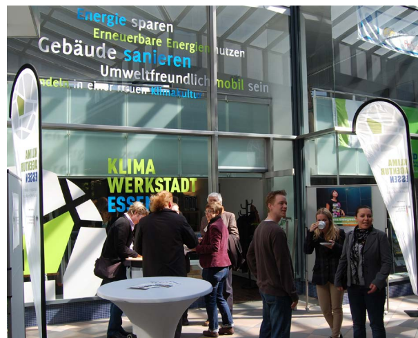
Anlaufstelle für Forschung, Wirtschaft, Bürgerinnen und Bürger: Die Klimaagentur in der Essener Innenstadt

Über die lokale Kreishandwerkerschaft etablierte die Klimaagentur beispielsweise das funktionierende „Essener