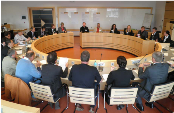
Runder Tisch Energieeffizienz im Rathaus

sind. Der Fokus der Treffen liegt darauf, geeignete Maßnahmen aufzudecken und Wege für deren Umsetzung zu erarbeiten. Als Ergebnis veröffentlichen beispielsweise die Akteure des Runden Tisches Wohnsektor eine Broschüre mit Vorzeigeprojekten.