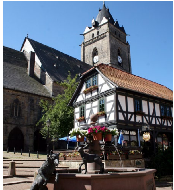
Die historische Kernstadt von Wolfhagen wird stark durch ihre Fachwerkhäuser geprägt

Ein Stromangebot aus erneuerbaren Energien unterliegt häufig starken Schwankungen. Wie der Verbrauch erneuer-