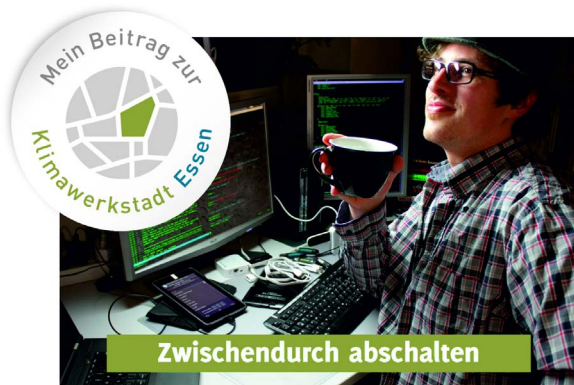
Milieugerechte Ansprache für eine gemeinsame Klimaverantwortung: Das Siegel der klima|werk|stadt|essen

Um das in der Essener Stadtgesellschaft vorhandene Potenzial im Sinne einer gemeinsamen Klimaverantwortung auszuschöpfen und das Engagement der lokalen Akteure auf breiter Basis sichtbar zu machen, wurde das Siegel-Konzept der klima|werk|stadt|essen als Grundlage für Aktivierungskampagnen umgesetzt.